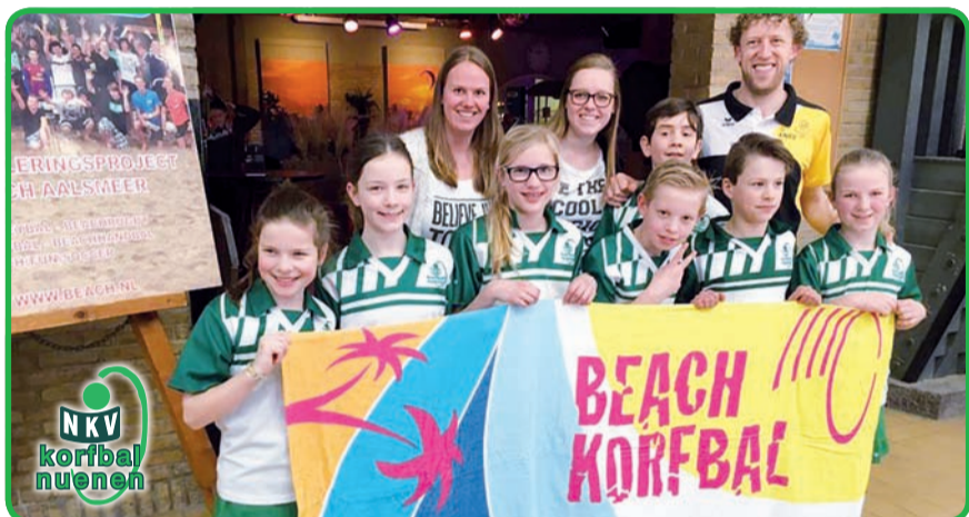
Het kampioensteam van NKV E1 met begeleiding.

Al met al was het een hele leuke dag in Aalsmeer, met 7 kinderen die genoten van ieder moment in het zand en 2 ontzettend trotse coaches. De beker is mee naar Nuenen, en we raden iedereen binnen NKV aan om volgend jaar ook mee te doen.