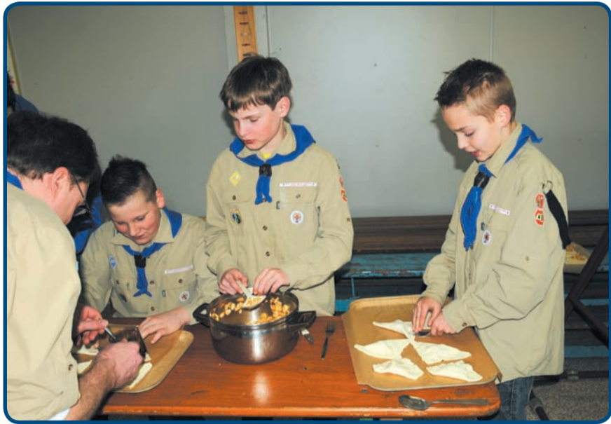
Leden van Scouting Lieshout - Mariahout zijn vol enthousiasme bezig met de voorbereiding van de High-Tea (ranja) ter gelegenheid van de viering van Baden Powell dag 2016.

Voortvarend gingen alle groepen aan de slag met het schillen van appels, rollen van bladerdeeg en nog veel meer. Binnen enkele minuten was het dan ook een drukte van belang en werd er naast de officiële instructies ook crea-