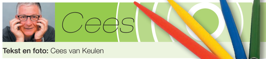
Tekst en foto: Cees van Keulen