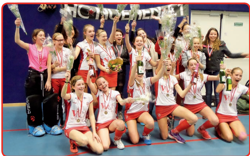
Het team van Nuenen MC1, kampioen van het zaalseizoen.