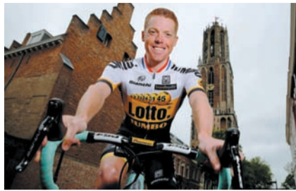
De Nuenense profrenner poseert in Utrecht.....

Vorig jaar werd 'De Kleerhanger', 'Het Vierkant van Brabant', 'De Nuenense