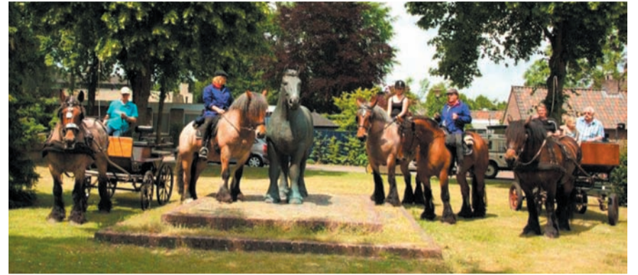
Poseren bij het 'echte' bronzen beeld was voor de deelnemers een mooi fotomoment.

Vooral het ongedwongen karakter van de tocht was voor veel deelnemers een extra argument om deel te nemen.