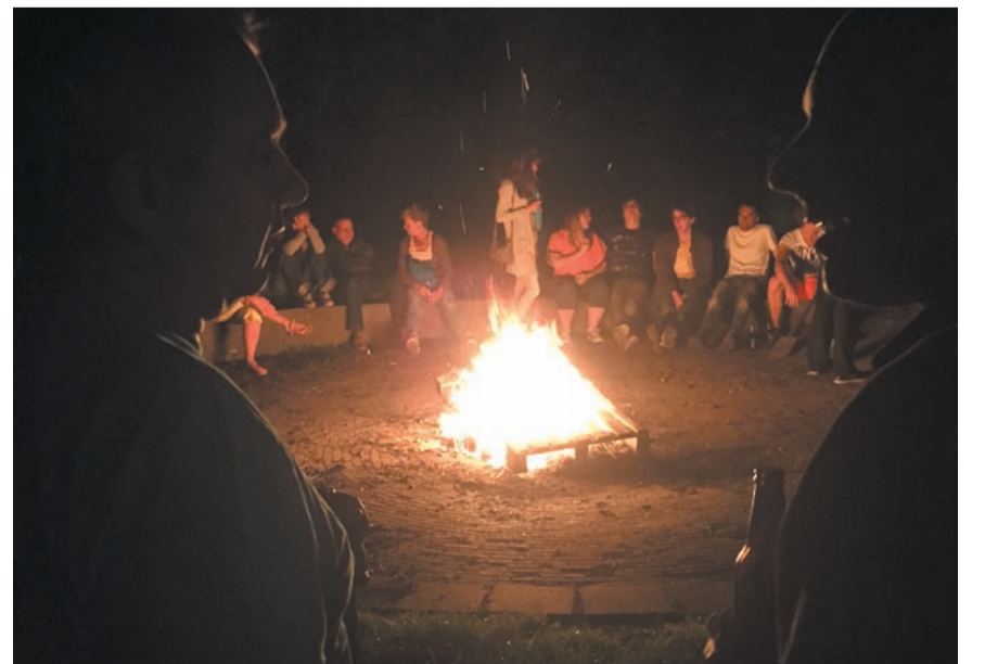
Rondom het kampvuur was het gezellig en goed toeven.

Ondanks de activiteit in het kader van de seizoensafsluiting blijven de badmintonners van Badminton Club Lieshout nog even doorsporten: de sporthal is immers nog open en dus kan er nog wekelijks gesport worden. Omdat het seizoen echter voorbij is, zullen ze niet meer trainen en zal er alleen nog maar wat vrij gespeeld worden. De allerlaatste speelavond van dit seizoen is op woensdag 15 juli 2015. Dan begint de zomerstop die dit jaar zal duren tot woensdag 2 september 2015: dan zal de eerste speelavond worden afgewerkt van het seizoen 2015/2016.