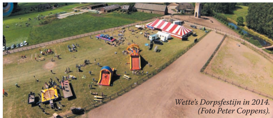
Wette's Dorpsfestijn in 2014.

Op maandag stond het jaarlijks terugkerende rikken weer op het programma. Met een 70-tal sportieve deelnemers is het rikkoernooi een goed bezochte activiteit tijdens het festijn. Onder het genot van de klanken van zanger Jan van der Heijden genoten de bezoekers van een heerlijke barbecue. Onder het genot van een drankje is het Wette's Dorpsfestijn 2015 succesvol afgesloten. Volgend jaar zullen de festiviteiten plaatsvinden op 24 t/m 27 juni.