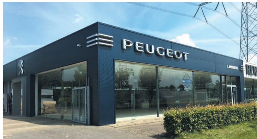
Het moderne functionele bedrijfspand aan Kruisakker 14 in de vernieuwde Peugeot-huisstijl.

Intratuin & Schapenhouderij Adriaans Een bijzonder zelfportret van bijna 50 m2 zal door Intratuin gerealiseerd worden van ruim 2.000 lavendelplanten tijdens Bloem & Tuin. Ook komen ze met een echte nostalgische groentetuin die na het evenement ter beschikking zal worden gesteld aan de Nuenense voedselbank. Ook komt er een grote kruidentuin met alleen PUUR biokruiden en ook de 'vergeten groenten' zullen niet 'vergeten worden'. Samen met schapenhouderij Adriaans met kwaliteit wolproducten zal de stand voor 2015 er top uit komen zien, aangekleed met vele rozen, hortensia's, zonnebloemen en boerderijdieren.