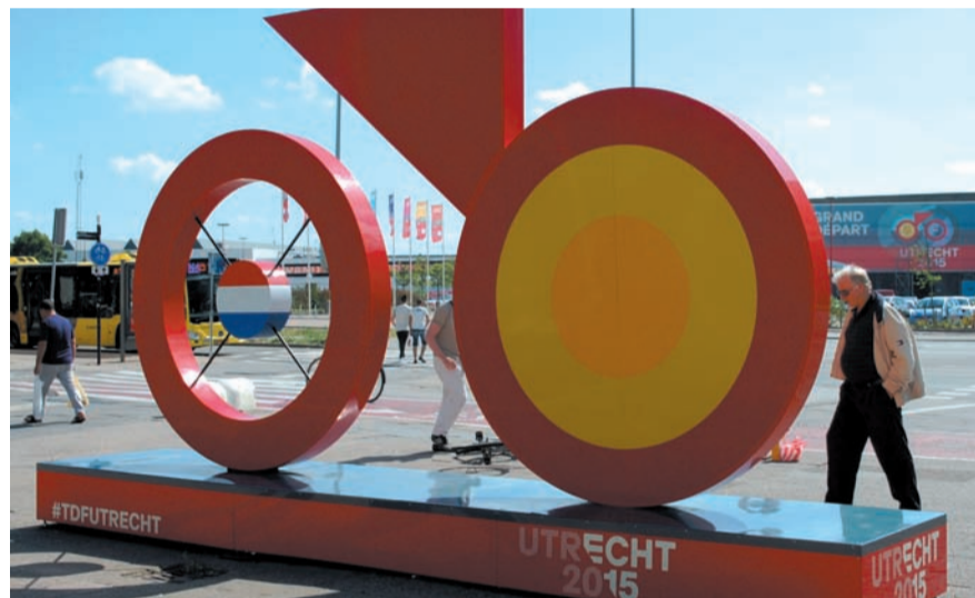
Utrecht staat al wekenlang in het teken van de Grand Départ.