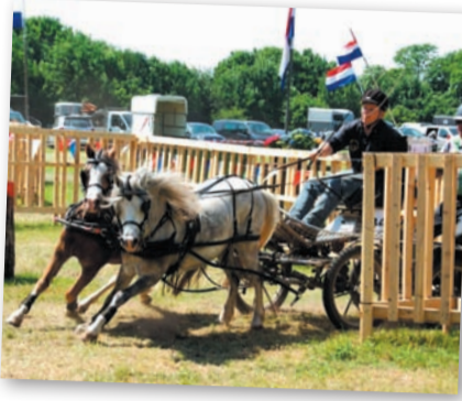
De Coovelse Menners decoovelsemenners@gmail.com www.decoovelsemenners.nl

Er zullen enkel-en tweespan en enkele vierspanmenners met pony's en paarden aan de start verschijnen. Het parcours is opgebouwd uit verschillende onderdelen waaronder dressuur en vaardigheid. Het onderdeel vaardigheid is opgesplitst in 2 uitdagende trajecten waarbij er op traject A een aantal kilometer afgelegd moet worden met een gemiddelde snelheid. Traject B bestaat uit verschillende spectaculaire hindernissen die binnen een bepaalde tijd afgelegd moeten worden. Tijdens dit traject telt elke seconden! Laat u met het hele gezin meevoeren in dit geweldige paardensport evenement.