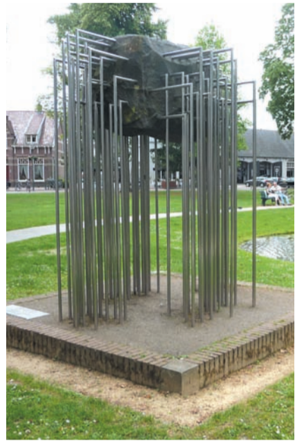
Het monument voor de Brabantse Kloosterorden van Theo Besemer staat vanaf 1987 in het Park. (foto: Roland van Pareren, 28 juni 2015)

In 1987 is het monument geplaatst mede ter herinnering aan de zusters van JMJ, die gedurende bijna honderd jaar vanuit Het Klooster het onderwijs en de ziekenzorg in Nuenen, Gerwen en Nederwetten behartigden. Een eventuele overplaatsing van dit monument naar een plaats achter Het Klooster doet volgens de cultuurhistorische vereniging afbreuk aan de grote betekenis die de zusters voor onze gemeente hebben gehad. Om die reden vindt de Heemkundekring dat het monu-