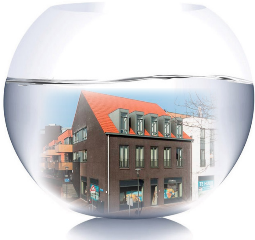
Berg 19 - Nuenen

Berg 19 - 5671 CA Nuenen T (040) 283 30 57 www.metselaarsmakelaardij.nl