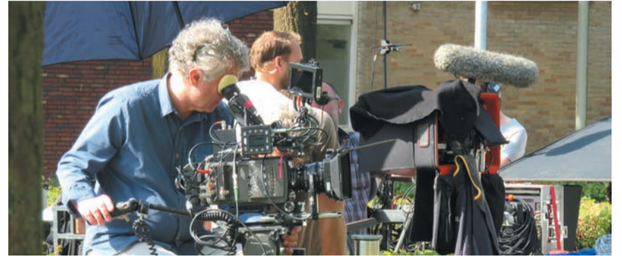
Filmopnames voor Nederlandse speelfilm Helleveeg.

is, stuurt hij aan op een confrontatie, waarbij alle familiegeheimen aan het licht komen. De regie van de film is in handen van André van Duren, die eerder De Bende van Oss maakte. Naar verwachting draait de film in maart 2016 in de Nederlandse bioscopen.