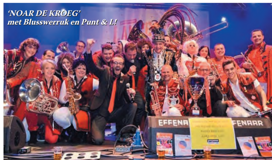
'NOAR DE KROEG' met Blusswerruk en Punt & L!

Het winnen van het Eindhovens carnavalslied brengt ook veel leuke optredens met zich mee. Ze zullen samen op meerdere locaties hun nummer ten gehore brengen zoals o.a. het bekende 'Federatiebal', 'Pekske Pronken', 'd'n vuropocht' en diverse optredens in het Pullman hotel en meerdere malen in de feesttent op de markt in Eindhoven. Zaterdagavond met carnaval zijn ze ook samen live te zien bij Omroep Brabant in het 'Fijnfisjenie café'! Kortom carnaval 2015 belooft voor Punt & L en Blusswerruk een druk maar vooral gezellig feestijn te worden.....!