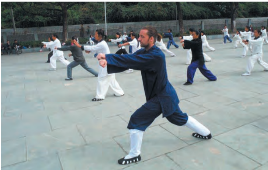
Kung Fu school in Nuenen.

De open dag is op zaterdag 22 februari in de Hongerman (Hoge Brake 3). De workshop Tai Chi en Meditatie start om 15.00 uur na een pauze begint om 16.00 uur de workshop Wushu. De Wushu workshop wordt ook voor kinderen gegeven. Natuurlijk is iedereen welkom voor beide. De workshops zijn gratis bij te wonen voor alle geïnteresseerden. Belangrijk is het voor de mensen die deel willen nemen om kleren waar in je makkelijk kunt bewegen en gymschoenen aan te hebben. Mensen die zich aanmelden voor lessen op de open dag kunnen rekenen op een korting van 10%. Meer info: www.wudangwushu.nl of www.facebook.com/wudangwushuhschoolofmartialarts