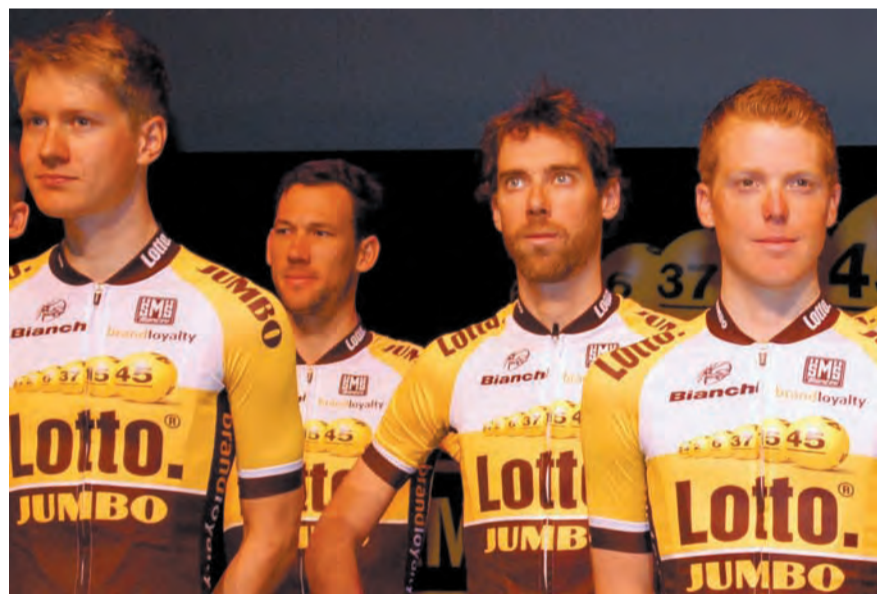
Vier renners van het Team LottoNL-Jumbo (v.r.n.l.): Steven Kruijswijk, Laurens ten Dam, Maarten Tjallingii en Wilco Kelderman...

De Fanclub Steven Kruijswijk bestaat nog op papier. De wielrenner heeft wel de banden met de fanclub doorgesneden. De leden van de fanclub zijn door het bestuur uitgenodigd voor een bijeenkomst in clubhuis café de Stam in Gerwen. Ook andere belangstellenden zijn welkom in de Stam op vrijdagavond 23 januari vanaf acht uur. Daar staat de toekomst van de fanclub op de agenda.