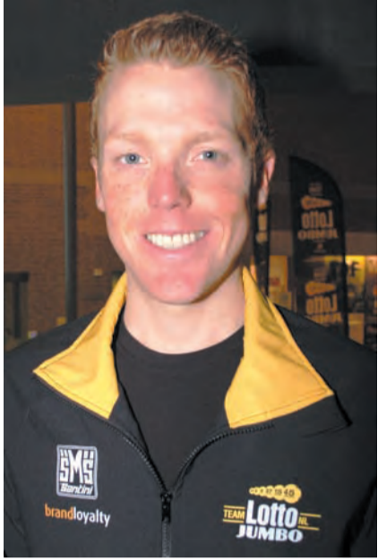
Steven Kruijswijk uit Nuenen.

Profrenner Steven Kruijswijk uit Nuenen heeft voor dit wielerseizoen twee grote rondes op zijn programma: de Ronde van Italië (Giro) en de Ronde van Frankrijk (Tour de France). De 27-jarige wielrenner start als kopman in de Giro en als 'knecht' in de Tour. De eerste etappekoers is de Ronde van de Algarve van 18 tot en met 22 februari.