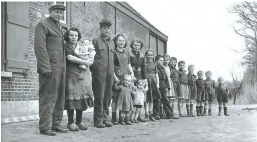
Gezin van Aert uit Leur (16 kinderen) emigreert naar Canada, 1950.

Wanneer het fenomeen 'grote gezinnen' ter sprake komt, wordt al snel de opmerking gemaakt dat dit iets uit het verleden is. En dat het met het rooms-katholieke geloof te maken heeft. En