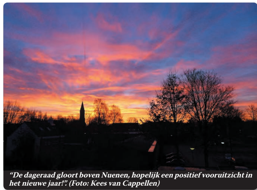
"De dageraad gloort boven Nuenen, hopelijk een positief vooruitzicht in het nieuwe jaar!".