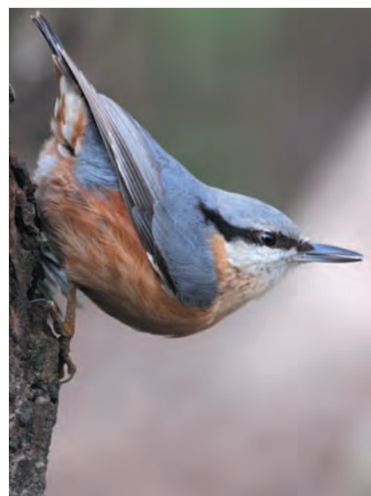
De boomklever.