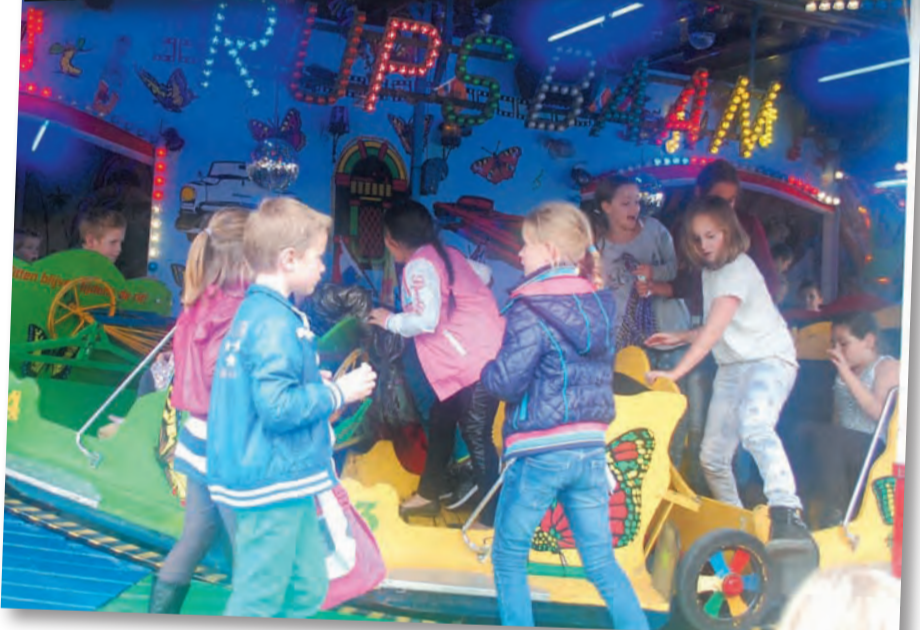
Tekst en foto's Cees van Keulen.