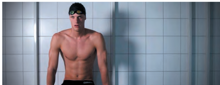
Still uit 'Success Starts With Dedication'.

tijdens het programmablok 'Ontdek de iNfo film' van het NFF in Utrecht op maandagavond 29 september van 20.00-23.00 u in zaal Cloud Nine van het nieuwe filmfestival hart TivoliVredenburg. Kaarten à € 9,50 kan men reserveren via: www.filmfestival.nl/publiek/evenementen/nff-presenteert-ontdek-de-infofilm-2014 .