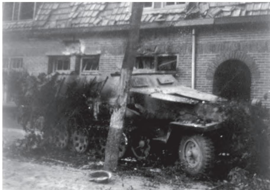
De uitgebrande tank voor Miens ouderlijk huis aan de Soeterbeekseweg. Dit blijkt een Duits halfrupsvoertuig te zijn.

Later in de avond wordt het wat rustiger. Broer Adriaan besluit om even naar huis te lopen om dekens en een spade te gaan halen. De rest van de familie loopt door het Broek naar de Nieuwe Dijk bij Stad van Gerwen. Aan de linkerkant van de weg staat een boerderij waar we in de stal mogen gaan slapen. Het is er behoorlijk fris. Onze poes is al die tijd meegelopen en moeder zegt: 'Da's mijn bedkruik voor vannacht!'