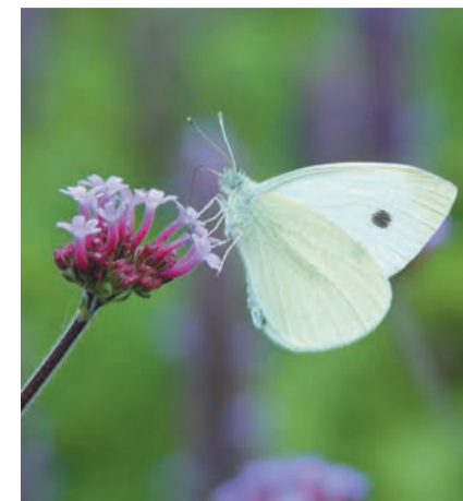
Kleinkoolwitje, (foto: Henk Bosma).

Een oogje in het zeil. Laat uw naasten wat vaker binnenwandelen! Of spreek bijvoorbeeld af dat u iedere dag op een vast tijdstip belt, of wordt gebeld. Als een van uw trouwe mantelzorgers op