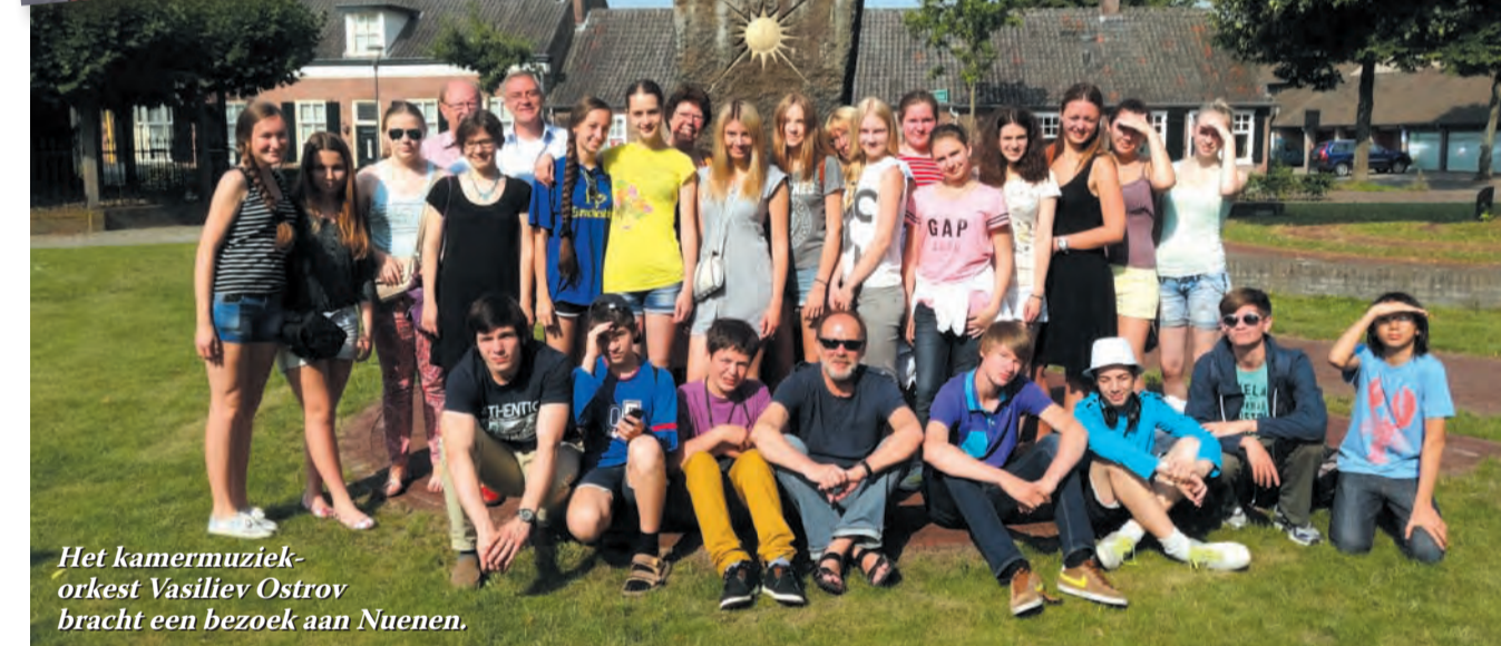
Het kamer-muziek-orkest Vasiliev Ostrov bracht een bezoek aan Nuenen.