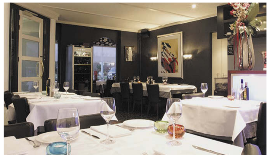
La Dolce Vita

In de regio Eindhoven kun je onder andere aanschuiven bij Avant Garde*, De Lindehof*, Olio, De Gouverneur en La Dolce Vita.