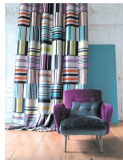
Stoeltje gestoffeerd in twee kleurcombinaties afkomstig uit het gordijn.

Stichting "Warme Beer", met voorzitter Tomas uit Nuenen, stelt zich ten doel om jaarlijks aan zo'n 400 kinderen met kanker op de oncologische afdelingen van de diverse ziekenhuizen in geheel Nederland, een "warme beer" te schenken. Zonder steun en donatie is het onmogelijk om dit streven jaarlijks ten uitvoer te brengen, vandaar dat Tomas deze dag ook zelf aanwezig zal zijn. Het doneren van een financiële gift is natuurlijk ook mogelijk. Voor informatie: www.warmebeer.nl