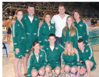
Deelnemers Juniorcup samen met Pieter van den Hoogenband.

In de pauze tussen de series en de finales van de Swimcup werd op zaterdag de Pietercup gehouden en op zondag de Juniorcup. Bij de allerjongsten