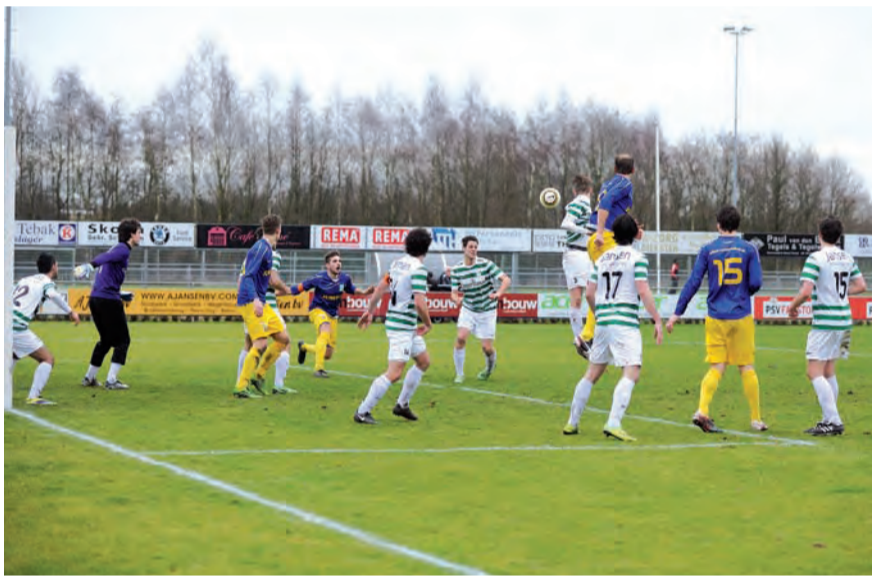
Alle hens aan dek in het Nueneense strafschoopgebied.

Volgende week komt SV Deurne op bezoek. In de heen wedstrijd boekte RKSV Nueneen daar de eerste zege van het seizoen. Met de zondag getoonde werklust moet het mogelijk zijn om de eerste overwinning in 2014 te boeken.