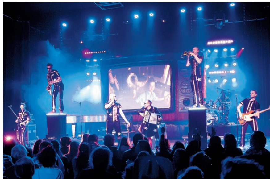
Lijn 7 in 2012 tijdens Paaspop in Schijndel.

Lijn 7, zaterdag 18 januari in café Ons Dorp in Nuenen. Aanvang 21.00 uur, toegang vrij.