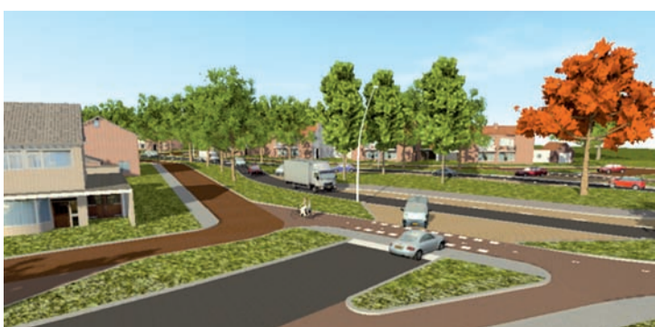
Europalaan vanuit Vallestep (variant 1 B, C)

De varianten die het gemeentebestuur het meest kansrijk vindt, zijn weergegeven in de bijlage. In de ene groep varianten (1 a t/m c) wordt de Europalaan over de volle lengte van 3 kilometer, tussen de Dommel en 't Pluuke gereconstrueerd. Het ontwerp met verkeerspointjes kan je toepassen op alle kruisingen, binnen het nieuwbouwplan Nuenen-West, maar ook in een langgerekte vorm tussen de Geldropsedijk en de Parkstraat (1a). De verschillen zitten in de mogelijkheid linksaf te slaan vanuit de Parkstraat (1b) en ook nog vanuit de Geldropsedijk (1c). Bij de andere variant (2) wordt alleen het deel tussen de Dommel en de Geldropsedijk helemaal opnieuw ingericht. Op het deel tussen Geldropsedijk en 't Pluuke worden dan alleen nieuwe verkeerslichten geplaatst en wordt het asfalt niet vervangen, maar alleen opgeknapt om de weg weer een paar jaar rijdbaar te houden.