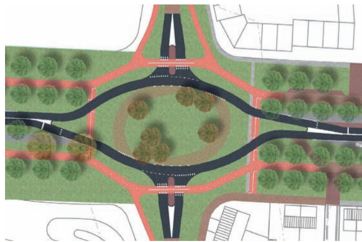
Voorbeeld voorrangspointje bij Nuenen-West