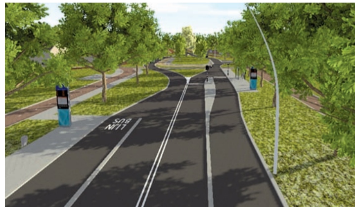
Europalaan richting Geldropsedijk (rechts)

Er is nog geen beslissing genomen om de reconstructie op de ene of andere manier uit te voeren. Toch is er ook al verder nagedacht over de uitwerking van die plannen: welk soort asfalt, oplossingen voor waterafvoer, materialen, bomen, straatmeubilair, lichtmasten... Ook die belangrijke "details" horen bij een definitief plan, dus ook daar mag iedereen een mening over geven. Welke oplossing er uiteindelijk gekozen wordt (varianten en details) is aan het college van burgemeester en wethouders en de gemeenteraad. Het college beslist - mede aan de hand van alle inspraakreacties (Inspraaknota) - welk voorstel naar de gemeenteraad gaat. College en raad zullen ook aspecten zoals financiering meewegen.