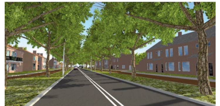
Smalle deel tussen Vallestep en Geldropsedijk

Het plan biedt natuurlijk ruimte voor de bus. De Europalaan is ook een van de belangrijkste verbindingen voor auto's tussen Nuenen en Eindhoven en zal dat ook blijven. Daarnaast is het ook een belangrijke fietsverbinding. Met al deze wensen en eisen is rekening gehouden in het ontwerp; er is een balans gezocht tussen HOV, autoverkeer en fiets. Het project is dus niet dé oplossing voor doorgaand autoverkeer. Nog meer autoverkeer zou ook niet goed zijn voor de leefbaarheid in ons dorp. Maar het is ook geen 'autootje pesten'. De doorstroming is goed. Behalve een stimulans voor het openbaar vervoer biedt het plan goede voorzieningen voor langzaam verkeer. Fietsers kunnen in twee richtingen langs de Europalaan rijden.