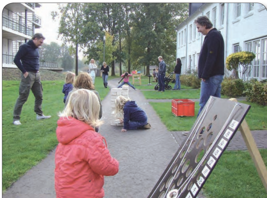
Op de laatste dag van de herfstvakantie, vorige week, organiseerde enkele gezinnen van de Clemensakker een gezellige spelletjesmiddag voor de kinderen. Mede dankzij het weer werd het een geslaagd initiatief. Er is zelfs een verkering ontstaan tussen twee jonge deelnemertjes.