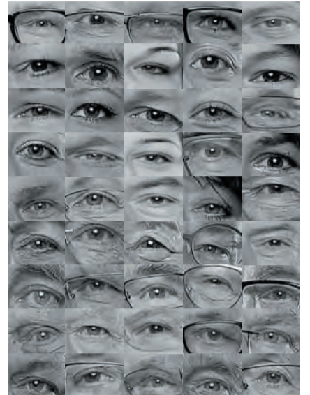
De ogen van de kandidaten van W70.

Op maandag 4 november aanstaande presenteert W70 officieel alle gezichten van haar 50 kandidaten voor de kieslijst ten behoeve van de gemeenteraadsverkiezingen op 19 maart 2014. De partij licht echter nu alvast graag een tipje van de sluier op, door de inwoners van Nuenen, Gerwen, Nederwetten en het Eeneind nu alvast kennis te laten maken met 50 ogen van deze kandidaten. Herkent u een of meerdere kandidaten?