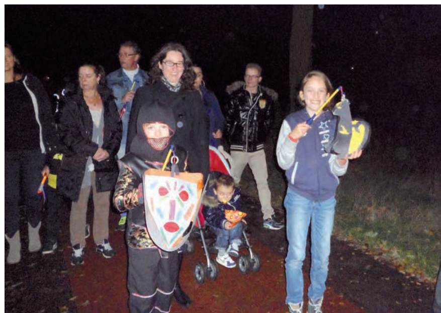
Geslaagde lampionnenoptocht B.S. Vrouwkensakker.

Donderdag 17 oktober was het weer tijd voor de jaarlijkse lampionnenoptocht. Vanaf 18.00 uur waren alle kinderen en ouders/verzorgers van peuterspeelzaal 't Dwèrsliggertje, basisschool De Nieuwe Linde, Korein Kinderplein Vrouwkensakker en Korein Kinderplein Jacobushoek welkom in de gezellig versierde aula voor soep en een lekker broodje. Nadat alle buiken gevuld waren ging men onder muzikale begeleiding van S.C. 't Eenodje op pad. Net als afgelopen jaren ging de route door de wijken rondom Brede school Vrouwkensakker. De gezellige optocht met verklede kinderen en vrolijke muziekklanken trok veel bekijks in de straten.