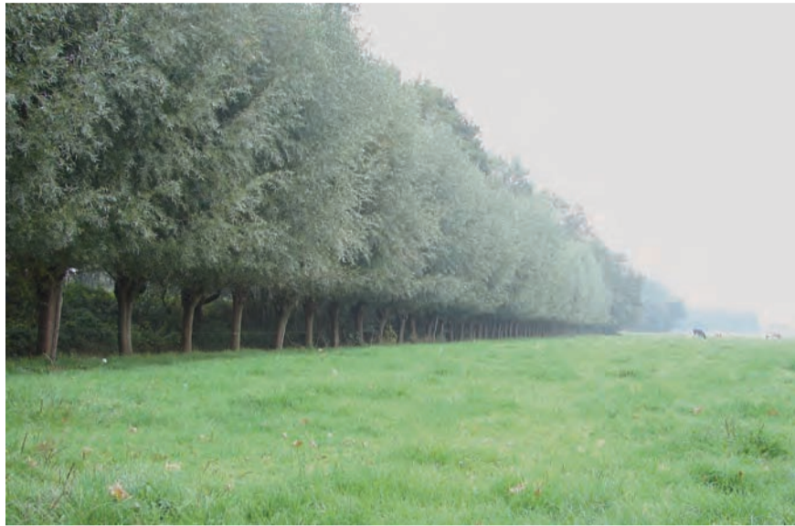
De Stad van Gerwen, waar geknot zal worden.

Jezelf, vrienden en familie aanmelden voor een gezellig dagje onder elkaar?! Voor mogelijkheid tot inschrijving, meer informatie en een overzicht van alle activiteiten in de buurt kun je terecht op www.natuurwerkdag.nl . De locatie is als volgt bereikbaar: De Stad van Gerwen ligt bij het Wilhelminakanaal ter hoogte van de ophaalbrug tussen Lieshout en Breugel. Voor de rou-