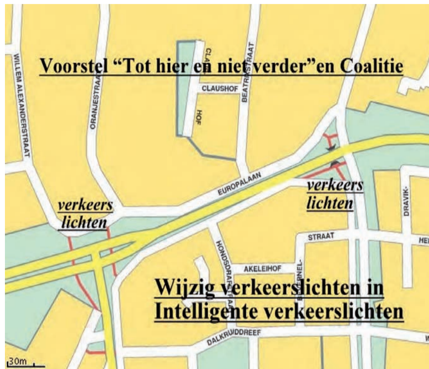
De huidige kruisingen die met slimme verkeerslichten niet helemaal op de schop hoeven.

Gerwen kermis een feest voor klein en groot