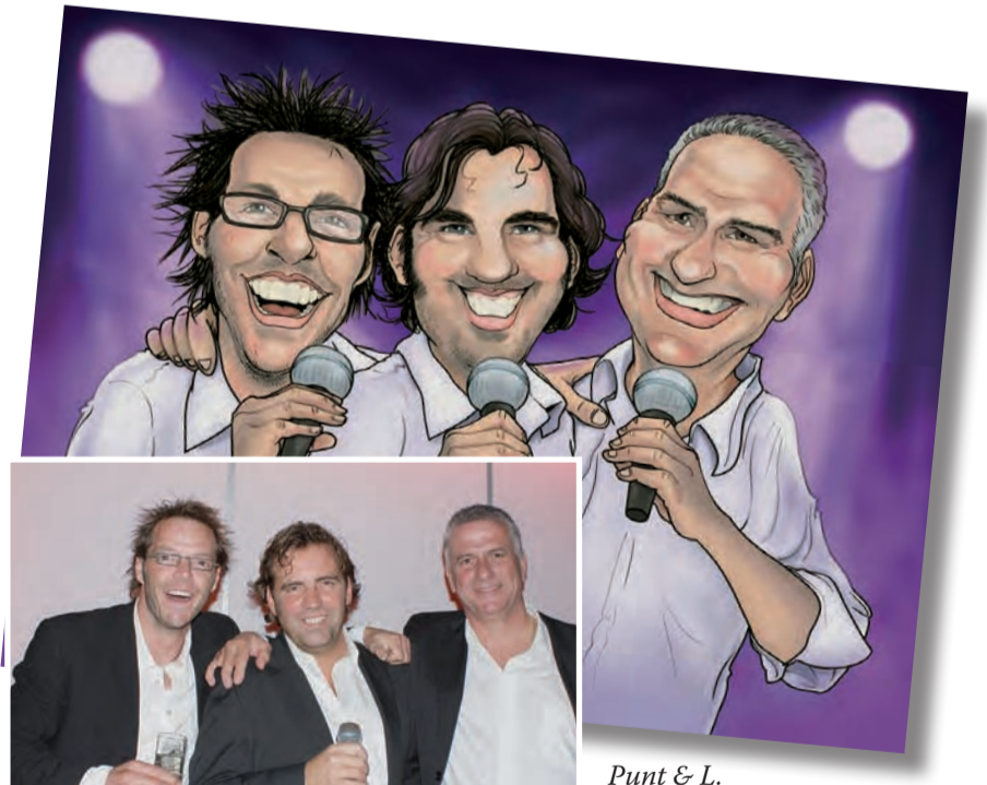
Punt & L.

Ruzies zijn er tussen de heren de afgelopen 15 jaar nauwelijks geweest. Wel 'meningsverschillen', die na enkele discussies en een goede borrel weer snel tot het verleden behoorden. Want koppigheid bezitten ze alle drie in hoge mate. Toch zorgt de passie voor muziek, de adrenaline die ze krijgen tijdens en na een optreden, dat stoppen niet in hun hoofd opkomt. Integendeel, de rollators met gitaar en versterker staan al klaar, zodat ze over een aantal jaar als bewoners van zorgcentrum De Akkers hun medebewoners met zang en muziek kunnen vermaken.