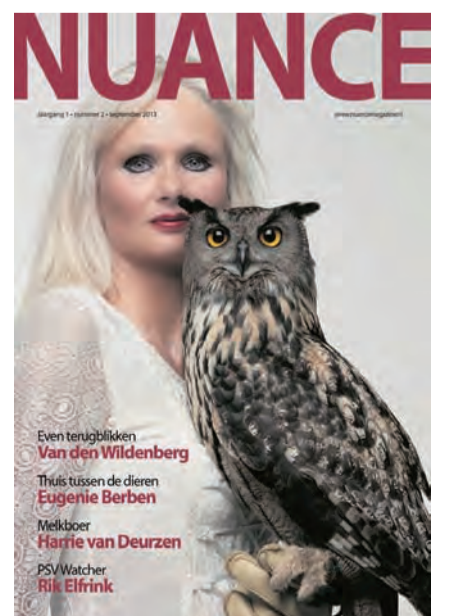
De cover van de tweede editie

Nuance wordt onder 11.000 huishoudens en bedrijven verspreid. Ook is het blad gratis verkrijgbaar bij lokale supermarkten en openbare gelegenheden in Nuenen, bij Albert Heijn in Brandevoort en de C1000 in Stiphout. De derde editie van Nuance verschijnt op 5 december aanstaande.