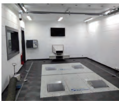
De rollenbankruimte waar auto's een snelheid kunnen bereiken tot 250 km/u terwijl hij stilstaat.

VAGTECHNIEK biedt een gratis wintercontrolebeurt aan voor lezers van Rond de Linde met een Volkswagen, Audi, of Skoda.