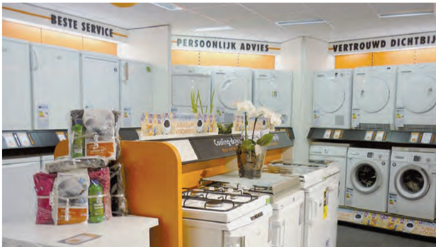
Veel witgoed en inbouw apparatuur en een heel ruime keus.

een ruime keus en heel veel verschillende merken. We komen geheel vrijblijvend bij u thuis om in te meten met een advies op maat als de klant daar naar vraagt. Na de aankoop bezorgen we het apparaat bij u thuis en we trekken pas als alles werkt." Ook op het gebied van inbouwapparatuur bent u dus bij Expert van Erp aan het juiste adres. Een begrip in Nuenen en in het concept van Expert is het gemotiveerde winkelteam. Gertjan Verhallen hierover: "De kracht van deze winkel is naar mijn mening de persoonlijke benadering en de kennis van de producten die we in huis hebben. Wij staan hier met een team dat graag de tijd neemt voor een klant en naar hem of haar luistert. Alleen zo kunnen we klanten immers helpen aan een helder en eerlijk advies. Voorop staat dat de klant met een tevreden gevoel de winkel verlaat en graag bij ons terugkomt."