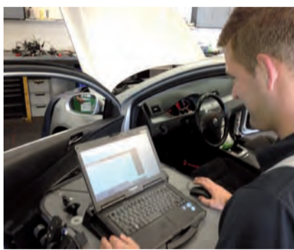
Controle van een auto met een computer.