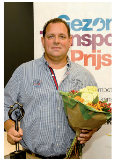
De prijs voor Gezond Transport ging bij de kleine bedrijven naar Van Dalen Transport B.V. uit Nuenen.

Met de Gezond Transport Prijs wil Gezond Transport bedrijven met een goed beleid en/of goede praktijken op het gebied van preventie, verzuim en re-integratie belonen voor hun inspanningen. Gezond Transport vraagt hiermee aandacht voor gezond en veilig werken in de gehele sector. Ook worden andere werkgevers in de sector gestimuleerd om dagelijks aandacht te besteden aan de duurzame inzetbaarheid van medewerkers.