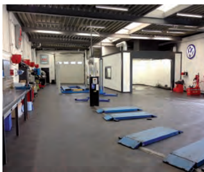
Moderne bedrijfsruimte met specialisten.