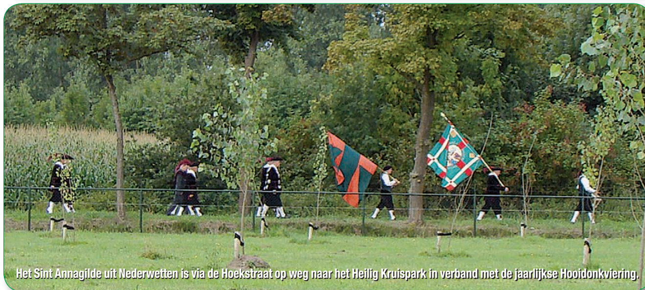
Het Sint Annagilde uit Nederwetten is via de Hoekstraat op weg naar het Heilig Kruispark in verband met de jaarlijkse Hooidonkviëring.

Heeft u interesse in een van deze vacatures of wilt u meer informatie, neem dan contact op met het Servicepunt - LEVgroep op Berg 22 in Nuenen. Dagelijks geopend van 8.30 - 12.30 uur of volgens afspraak tel. 040-2831675. Nieuwe vacatures kunt u aanleveren via ismene.borger@levgroep.nl