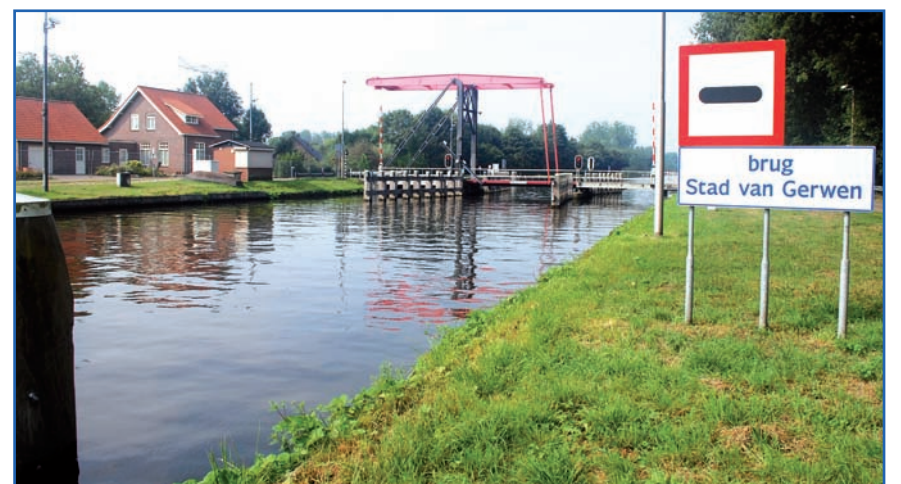
Het Wilhelminakanaal ter hoogte van Stad van Gerwen

Dorpsraad Gerwen wijst belangstellenden op de fietstocht van aanstaande zondag 8 september. Het is een demonstratieve tocht om aandacht te vestigen op het belang van natuur en milieu in deze omgeving. Fietzers kunnen vanaf kwart voor elf terecht op het kerkplein, waar om 11.00 uur wordt vertrokken voor een tocht naar Stad van Gerwen, over het Wilhelminakanaal richting Olen naar fietscafé De Krakenburg. Een paar betrokkenen zullen de fietsers daar toespreken. Ook fietsers die een tocht hebben gereden vanuit Aarle-Rixtel, Eindhoven, Lieshout, Nederwetten, Nuenen en Son en Breugel komen naar De Krakenburg.