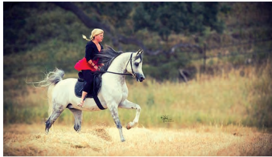
Galopperend over de wijde vlakte.

Naast onderzoek, besprekingen en bureauwerk zijn de werkzaamheden zeer veelzijdig. Sperma afnemen, invriezen en verzenden naar alle werelddelen, insemineren, bevallingen, nazorg, orders aannemen, paarden aan cliënten presenteren. Ook de begeleiding van stagiaires en werking van het personeel behoren tot haar taak. Ja ook nog weleens stallen uitmesten. Maar ook nu, net als vroeger in CaHaMa aan de Nuenense Beekstraat is de echte beloning de paarden in conditie brengen en houden, dus galopperen over de wijde vlakten tussen de bergen en de kust van de Grote Oceaan. Altijd mooi weer, lange werkdagen, 6 per week. Restaurantje op 10 km afstand, klein barretje in het dorpje dichterbij, waar de wijnboeren en soms toeristen komen. Uitgaan? Santa Barbara ligt maar op een half uurtje rijden.