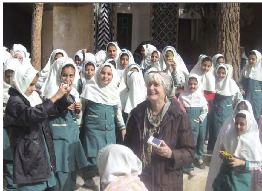
Dialezing “Het Andere Iran”

De lift in de Hongerman is beschikbaar. Aanmelden kan tot 13 maart via de website www.pvge-nuenen.nl of telefonisch bij Els Stultiëns (2833502 na 11.00 uur).