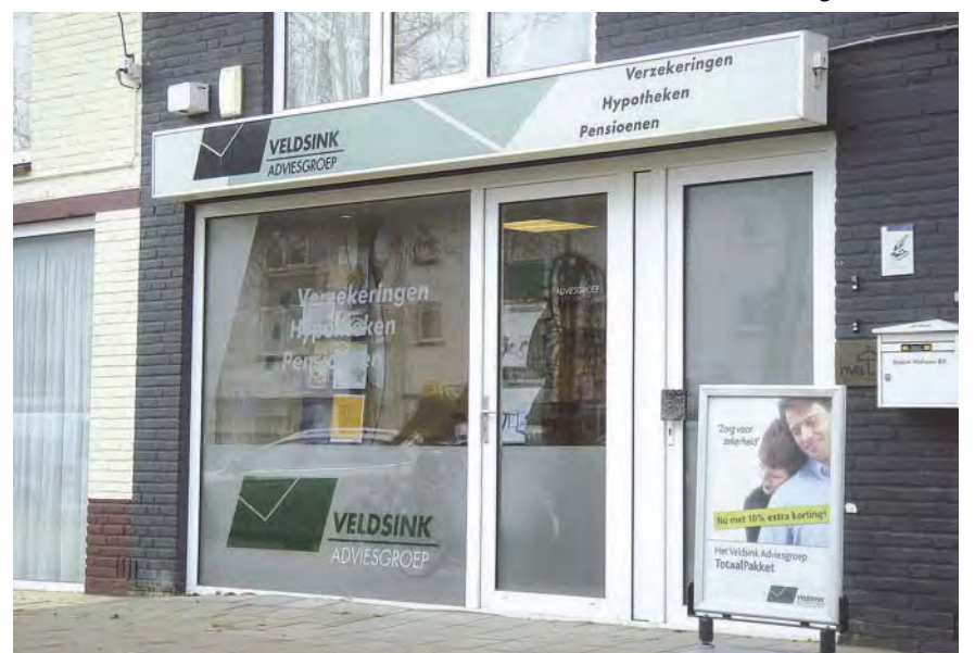
De Veldhovense vestiging van de Veldsink Groep aan de Burg. Van Hoofflaan

Veldsink Groep behoort tot de top 30 van de Nederlandse intermediairbedrijven en gelooft in gezonde regio-kantoren van voldoende omvang. Kantoren die dichtbij de klant staan, de klant kennen en gericht op het advies aan de klant, met ondersteuning van het moederbedrijf en een sterke en efficiënte backoffice-organisatie.