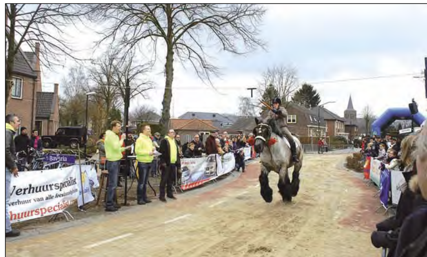
Het spectaculaire ringsteken in galop in Gerwen op zondag 3 maart

1e: ECV de Fiepkjes/Helmond met 7 raak uit 12; 2e: gedeeld Raod van Zaterdag en Narrekappen met beide 6 uit 12.