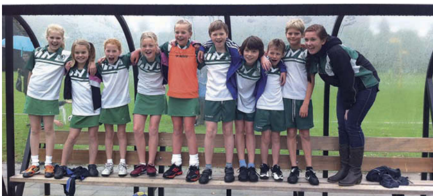
Alle kinderen zijn superblij dat ze kampioen zijn geworden.

NKV E1 een team met kinderen in de leeftijd 7 t/m 10 jaar allemaal super fanatiek en vanaf het begin van het seizoen riepen ze het al: "Wij worden kampioen!" En 13 oktober was het al zo ver: de kampioenswedstrijd voor NKV E1. Bij korfbal spelen ze 3 competities (1 ste deel veld, zaal, 2 de deel veld) waardoor ze nu al kampioen konden worden. De voorgaande wedstrijden werden op 1 gelijkspel na allemaal gewonnen. 1 keer hebben ze zelfs met 16-0 gewonnen!!! Op 13 oktober moesten ze nog tegen SDO, om kampioen te worden moesten ze winnen of gelijkspelen. SDO werd met 0-3 verslagen, door 2 doelpunten van Tijmen en 1 mooie doorloopbal van Lara. Na de wedstrijd zijn ze snel terug gegaan naar NKV en daar zijn de spelers gehuldigd met oorkondes, snoepzakken en veel kinderchampagne!!