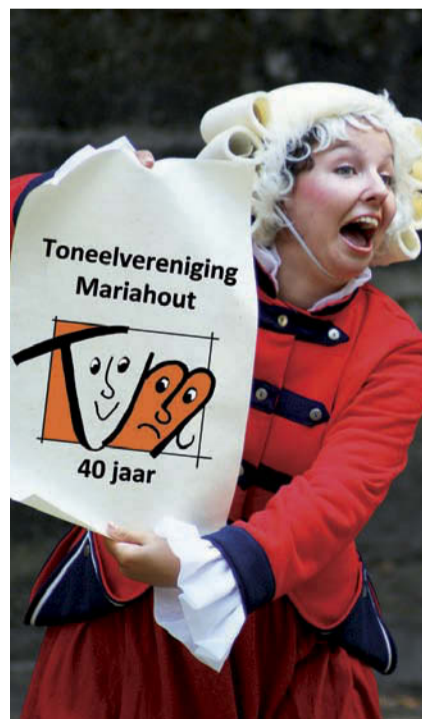
Toneelvereniging Mariahout bestaat 40 jaar.

De foto-expositie is voor iedereen vrij toegankelijk. Het verenigingsbestuur rekent op een grote belangstelling van hen die een warme band hebben met deze jubilerende club.