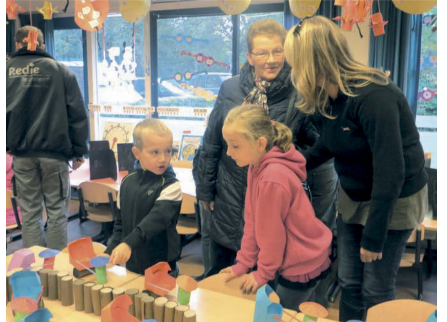
De kinderen hebben tijdens de kinderboekenweek hard gewerkt. De ouders genieten van het resultaat.

Ook was er nog een rode draad door de school met tekeningen van alle kinderen over hun 'mooie wereld'.