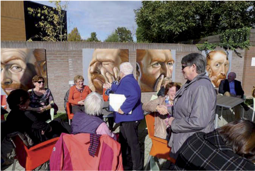
De regiobesturen van de Zonnebloem hebben kennis gemaakt met de Nuenense Vincent.

Gogh open-luchtmuseum. Wandelend langs de Van Gogh locaties, genietend van het gezellige Nuenen. Na afloop, onder het genot van een hapje en een drankje bij Le Souris, werd er nog nagepraat over de mooie dingen die Nuenen te bieden heeft. Het was voor de regiobesturen een geslaagde en inspirerende dag met veel herinneringen uit Nuenen.