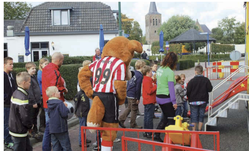
Het dorpsfeest in Gerwen is op de Gerwenseweg van 19 t/m 22 oktober

Hij staat binnen de vereniging vooral bekend als een gezellige en sportief