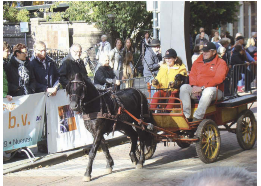
Een mooie combinatie die in het centrum veel bekijks heeft.

Afgelopen zondag is onder schitterende omstandigheden een geweldig mooie van Goghrit verreden. De organisatie kijkt terug op een succesvol verloop met heel veel deelnemers in alle klassen en geniet nog na, net als het talrijke publiek, van de mooiste combinaties.