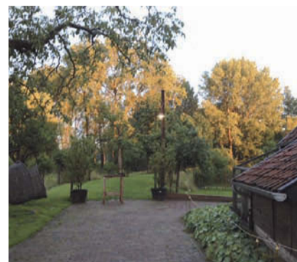
Een wandeling in een prachtige herfstomgeving bij de Opwettense Watermolen.

Het landgoed van Heerlyckheid de Opwettense Watermolen biedt een fantastisch herfst-plaatje. U bent van harte welkom om een wandeling te