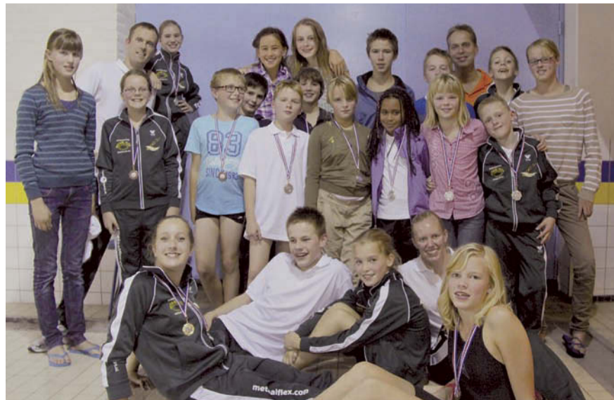
De zwemmers van Z&PV hebben 24 medailles en vele persoonlijke records behaald.

BEZORGING: Telefoon 06 - 48 69 89 19 cuijpersverspreiding@upcmail.nl Ook voor uw folders