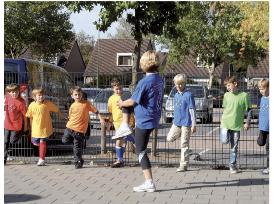
De kinderen zijn hard aan het trainen voor de Minimarathon op 14 oktober.