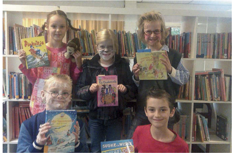
De "boekenhelden" van de Wentelwiek.

De rest van de week gaan de kinderen iedere dag voor elkaar optreden en in de klassen wordt er veel over boeken gepraat, getekend, geknutseld en er wordt natuurlijk heel veel gelezen! Op vrijdag 12 oktober sluiten ze de Kinderboekenweek af met een heuse flashmob. Iedereen is welkom om zich op deze vrijdagochtend rond 11.45 uur te laten verrassen!