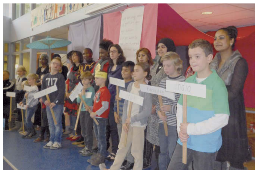
De kinderen van brede school Vrouwensakker begroeten hun internationale gasten.

De Kinderboekenweek duurt nog tot en met zondag 14 oktober. Voor meer informatie www.denieuwelinde.nl .