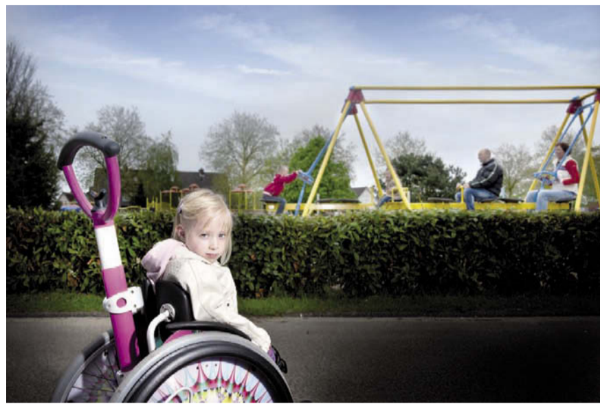
NSGK voert campagne voor toegankelijke speeltuinen. Speeltuin De Kievit in Nuenen is al rolstoeltoegankelijk en beschikt ook over een mindervalidentoilet.

NSGK alleen dankzij de steun van donateurs en vrijwilligers, want de stichting is onafhankelijk en ontvangt geen overheidssubsidie. Daarom vraagt NSGK vanaf 13 juli aan alle Nederlan-