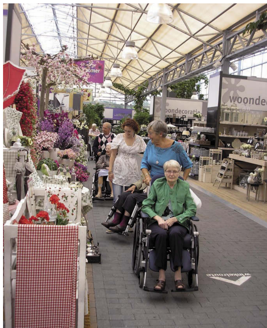
Bewoners van zorgcentrum De Akkers genieten van de bloemen, planten en snoeterijen in Intratuin.