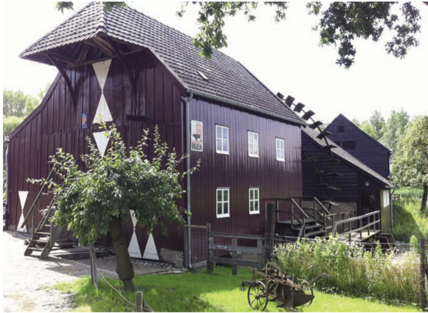
Het is goed toeven bij de Heerlyckheid

verse ingrediënten voor een toegankelijke prijs. Voor ieder wat wils. Tijdens de Holiday Fair kunt u onder andere kennis maken met het nieuwe BBQ-concept. Vanaf 29 juli zal elke zondag, bij droog weer, op het terras een BBQ staan waar de kok de lekkerste vlees-, vis- en groentegerechten ter plekke voor u bereidt. Met als absolute specialiteit de lekkerste spareribs van Ne-