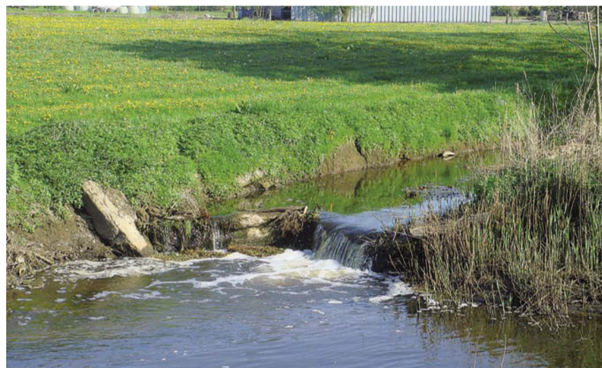
Samenloop van de Hooidonkse Beek met de Dommel nabij de Hooidonkse Watermolen.

Begin 2010 was er een expositie: Expositie Eindhoven in beeld op de Grote Berg. Toen is besloten om al deze navorsingen vast te leggen in een boek. De expositie viel samen met de start van het zogenaamde 17 kilometerplan van de gemeenten Eindhoven, Son&Breugel en Nuenen. Dit plan behelste een grootscheepse sanering