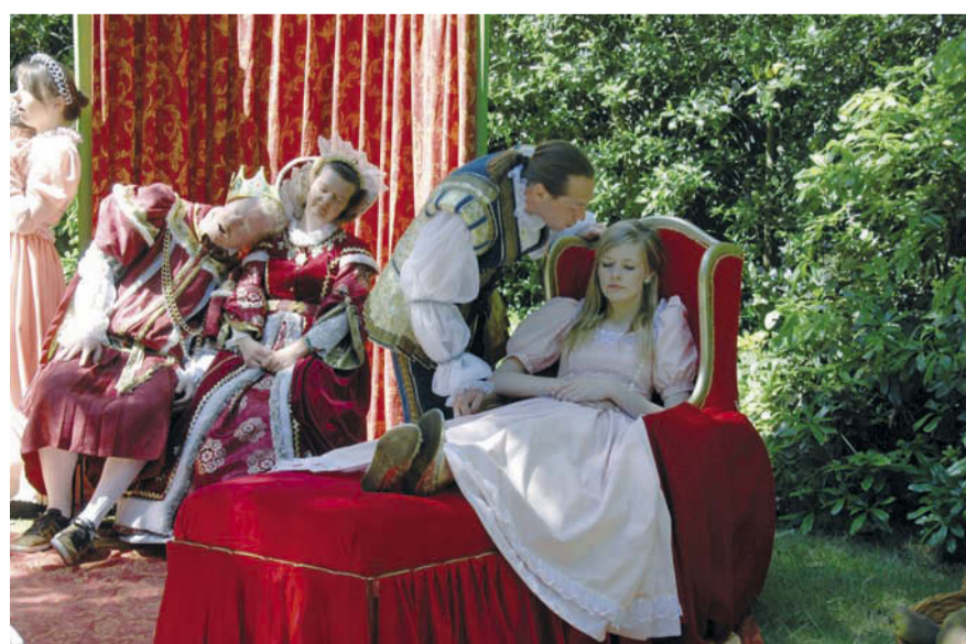
Krijgt Doornroosje de kus van de prins?

Je kunt het zelf komen zien op; donderdag 26 juli en 9 augustus om 14.30 uur en op zaterdag 11 augustus om 19.00 uur in Openluchttheater Mariahout. Meer informatie vind je op www.toneelverenigingmariahout.nl