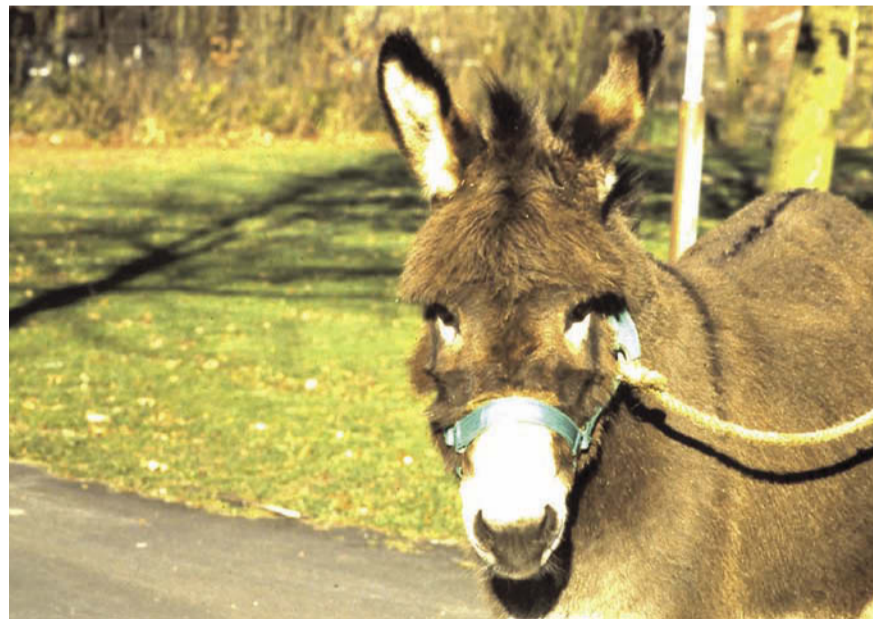
Veel volwassen kinderen zullen Norgje herinneren als rij-ezeltje op de paden van Weverkeshof tijdens lustrumfeesten.

In overleg met de dierenarts is besloten Norgje te laten inslapen. Voor de dierenverzorgers is dit een enorm gemis, maar ook voor de bezoekers, klein en groot die haar gebalk nu moeten missen. Omdat ezels groepsdieren zijn zal het bestuur en dierenverzorging op zoek moeten voor een nieuw kamaraadje voor Janette, de overgebleven ezel. Voor meer informatie: www.weverkeshof.nl .