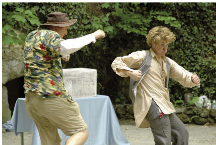
Sjluuk & Co

We wisselen onze ervaringen met planten uit. En ik verlaat Bloem & Tuin met een zak vol knollen. Met de belofte van de knollenvrouw dat de bloemen over 4 weken zullen bloeien!