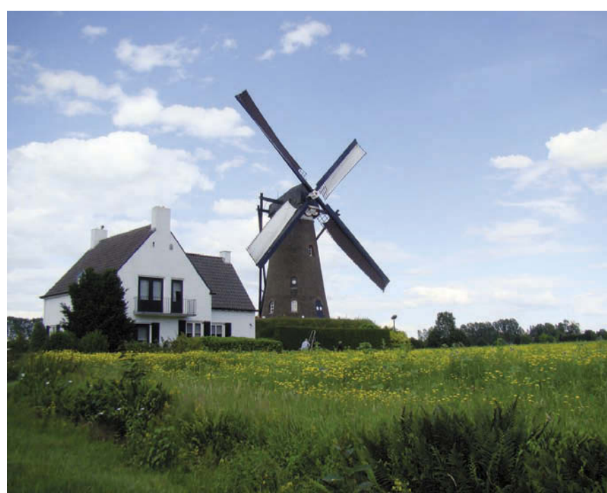
Molen de Roosdonck bevindt zich op dit moment midden in een gele bloemenzee. Ook dit jaar is het weer mogelijk om rondom de molen te wandelen. Het pad begint langs de Gerwense weg en via een bruggetje over de Hooidonkse Beek kom je dan uit bij het arboretum bij de gemeentevijver.