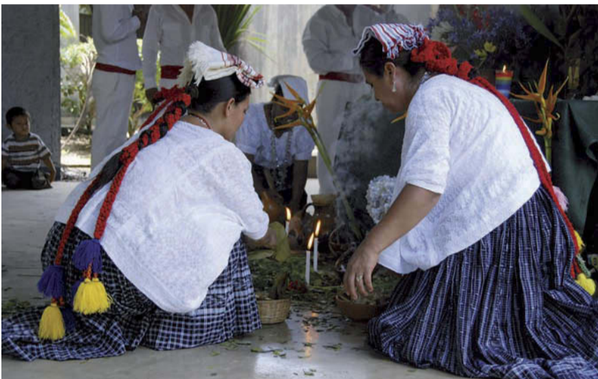
Maya vrouwen in oude offerceremonie

De woorden 'solidariteit' en 'gemeenschapszin' hoorden we daarna nog vele malen. Sleutelwoorden om als Maya-gemeenschap zelfbewust te worden van een rijke eigen cultuur en van onderlinge verbondenheid om aan de tweederangspositie in het land te ontworstelen. En die woorden golden ook in wereldverband door de verbondenheid met de Nuenense gemeenschap. Tucuru bestaat eigenlijk uit zo'n zestig dorpjes en gehuchtjes met in totaal 40.000 inwoners. Alle-