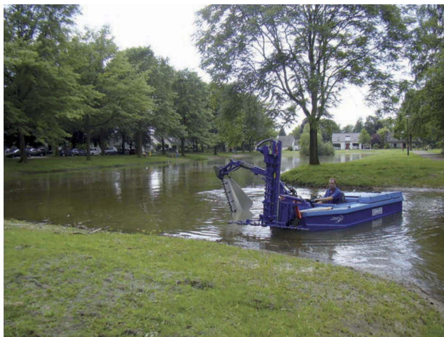
Een maaiboot van het waterschap demonstreert hoe in de toekomst onderhoud aan de waterpartijen plaats zal vinden.