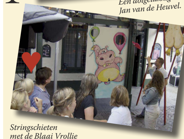
Stringschietsen met de Blaai Vrollie