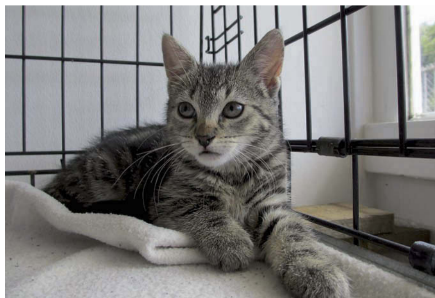
Tijdens de kittendag werden veel jonge dieren bemiddeld.

Vooraf oriënteren kan ook, via de website: www.dierenasieleindhoven.nl . Via het kopje 'Asieldieren' zijn foto's en beschrijvingen van ieder dier te zien.