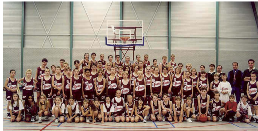
BC Lieshout nodigt oud-leden, sponsors en andere personen die betrokken zijn (gewest) bij de club uit voor de feestavond op 25 augustus.

In 2012 bestaat Basketball Club Lieshout alweer 40 jaar. Dit jaar zijn er diverse activiteiten en op 25 augustus een heus jubileumfeest.