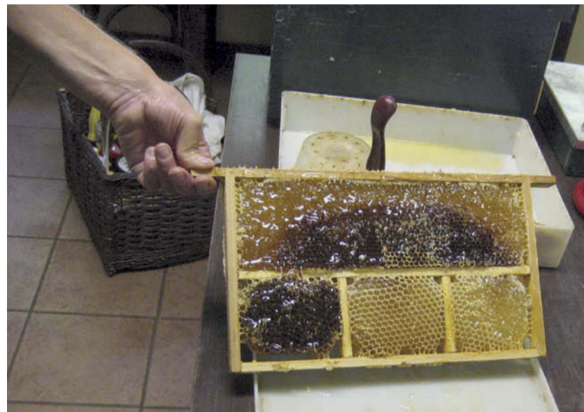
Bijenraat met honing

Op vrijdag 13 juli laat een imker tussen 9.30 tot 12.00 uur zien hoe de honing uit de raten wordt gehaald. Het IVN heeft een vitrine ingericht met informatie over solitaire bijen. Dat is een andere soort bijen dan de honingbijen. Sommige mensen vinden die solitaire bijen juist leuker, omdat die geen angel hebben.