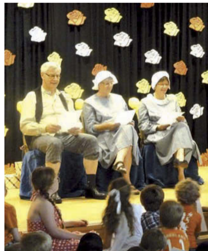
De juffen en de meester nemen afscheid en gaan even "terug in de tijd".

Omdat de dames en heer al lang in het onderwijs werkzaam zijn, had het feest het thema 'terug in de tijd' meegeregend. De leerlingen en teamleden waren verkleed als Ot, Sien of Pietje Bell en ook de feestvarkens werden geheel in stijl aangekleed. Er waren voor de leerlingen Oud-Hollandse spelletjes en een grote vossenjacht, met ijs onderweg! Onder het genot van een drankje konden vervolgens de juffen en meester persoonlijk bedankt worden.