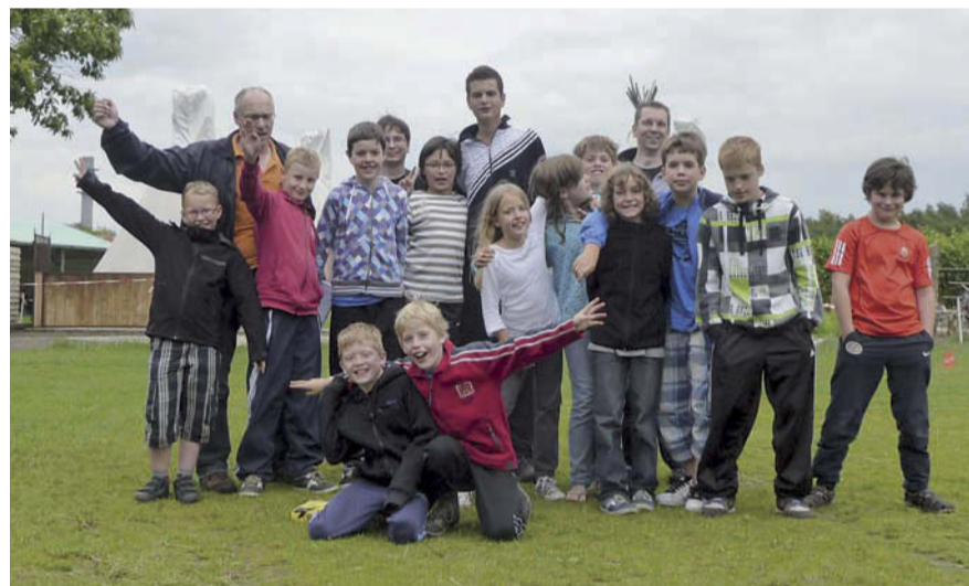
De jeugd van Badminton Club Lieshout heeft zich uitstekend vermaakt op het weekendkamp.