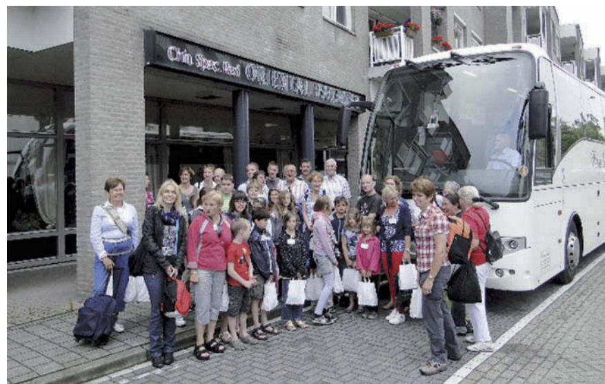
Het vertrek voor een dagje Ponypark Slagharen aangeboden aan de Poolse kinderen door de Oud-Prinsen.