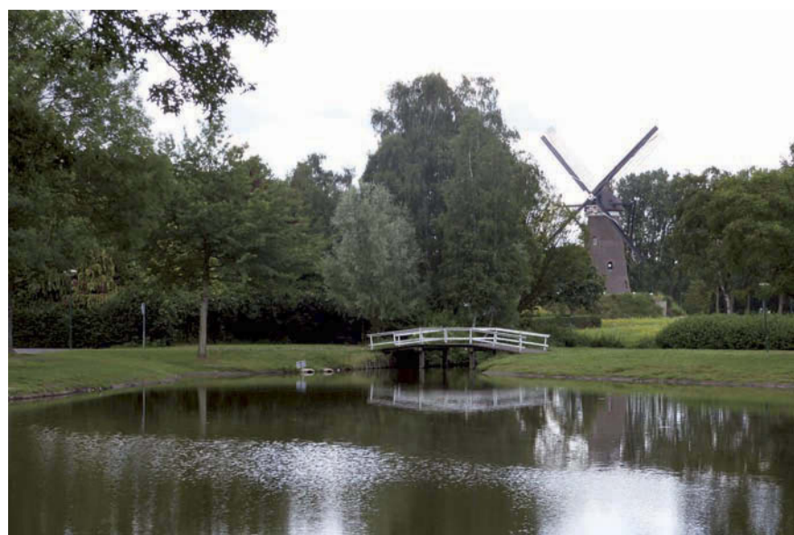
Blauwalg kan vervelende lichamelijke klachten veroorzaken.