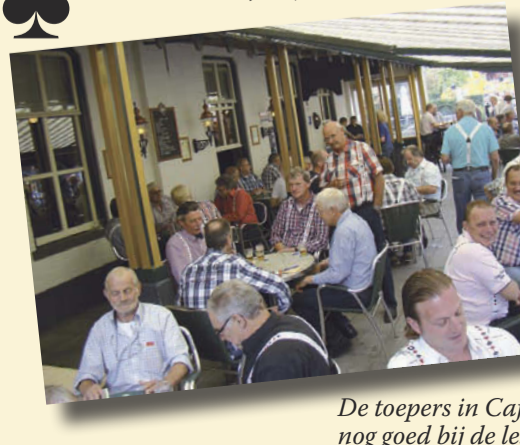
De toepers in Cafe Schafrath nog goed bij de les.

In 2012 bestaat Basketball Club Lieshout alweer 40 jaar. Dit jaar zijn er diverse activiteiten en op 25 augustus een heus jubileumfeest.