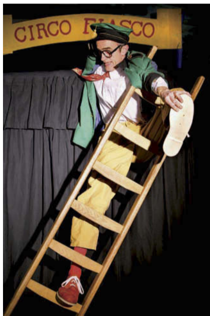
Circo Fratelli brengt hilariteit in het Openluchttheater Mariahout.

Een levendig clownsspektakel met komisch illusionisme, hilarische evenwichtstoeren en hartverwarmende muziek. In deze voorstelling is improvisatie troef en speelt het publiek de tweede hoofdrol.