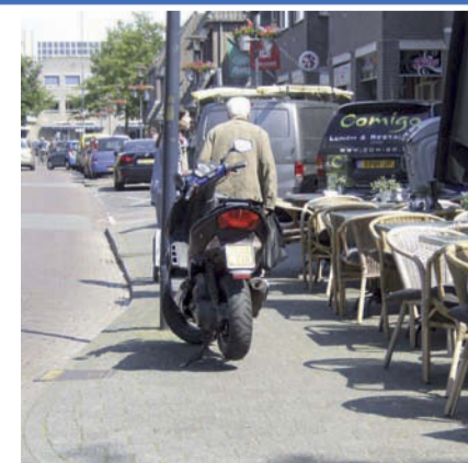
Het parkeergedrag van tweewielers blijkt nogal eens de oorzaak van obstakels voor mensen in bijvoorbeeld een rolstoel of scootmobiel.

Meer informatie over Platform Gehandicaptenbeleid Nuenen c.a. is te vinden op www.pgnuenen.nl .