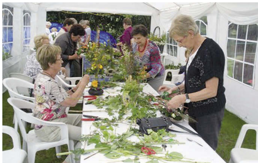
In de zomermaanden organiseren de vier Laarbeekse seniorenverenigingen weer een programma met bijzondere activiteiten. Net als vorig jaar is het bloemschikken er één van. Let op de informatie!

Op maandag 28 mei, tweede pinksterdag, is KBO Lieshout weer present op de jaarlijkse braderie. Van 11.00 tot 17.00 uur staan de vrijwilligers klaar om u informatie te geven of u als lid in te schrijven. Voor een euro kunt u daarbij genieten van een heerlijke pannenkoek, gebakken door de leden van Seniorenkoor Vogelzang uit Lieshout.