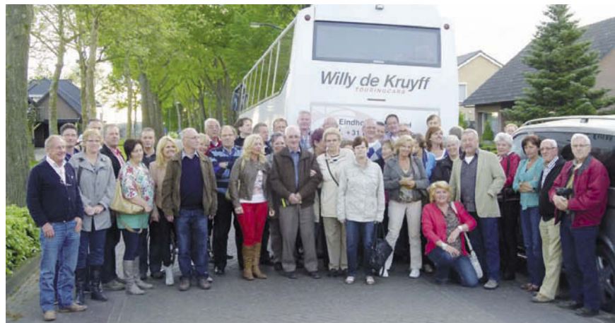
De jubilerende Vogelvereniging op reis.

Na een ritje van twee uur werd er in Casteren gestopt bij restaurant de Kruidenlucht om daar gezamenlijk een drie gangen menu te nuttigen om