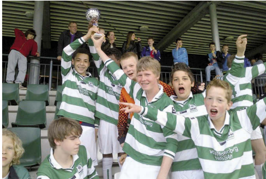
D6 is erg blij met de behaalde beker.

Na een moeizame start, 0-1 verlies, werden alle wedstrijden gewonnen. Ook de finale tegen Brabantia D3 was nog even spannend. Na een 0-1 achterstand werden de "ruggen gerecht" en stapten ze uiteindelijk als trotse winnaars met een 3-1 eindstand van het veld. Groot compliment voor de jongens van de D6 en een mooi afscheid van een leuk seizoen!