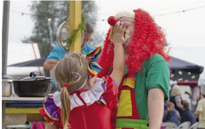
De kindervakantieweek in Gerwen is altijd een groot succes voor jong en oud.

De show is voor bezoekers geopend op 27 en 28 mei, van 9 tot 17 uur. Locatie: landgoed Gulbergen, Schoutse Vennen 15 te Nuenen